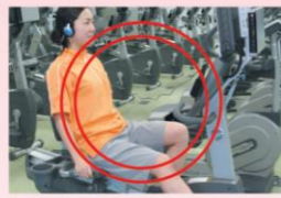
リカンベントバイク