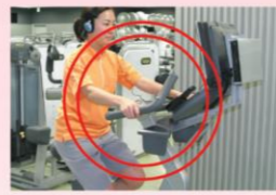
アップライトバイク