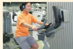
アップライトバイク