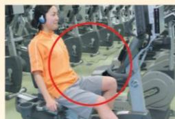
リカンベントバイク