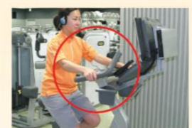
アップライトバイク