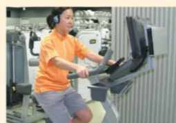
アップライトバイク