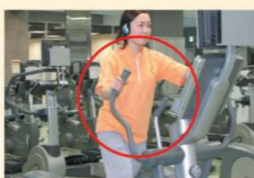
クロストレーナー