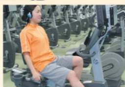
リカンベントバイク