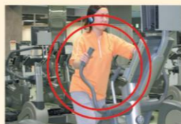
クロストレーナー