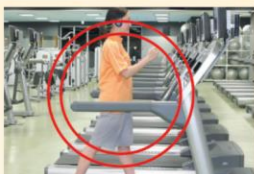
ランニングマシン

(心肺機能を高め全身的なスタミナアップ。余分な脂肪を燃焼させる。) ※特にオススメ◎ オススメ○