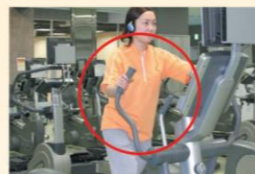
クロストレーナー