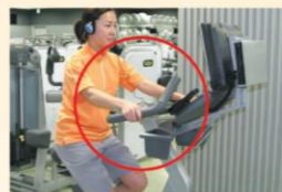
アップライトバイク