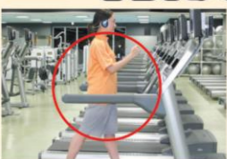
ランニングマシン

(心肺機能高め全身的なスタミナアップ。余分な脂肪を燃焼させる。) ※特にオススメ◎ オススメ○