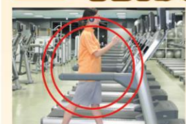
ランニングマシン

(心肺機能高め全身的なスタミナアップ。余分な脂肪を燃焼させる。) ※特にオススメ◎ オススメ○