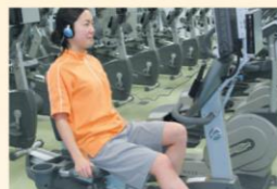
リカンベントバイク