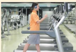
ランニングマシン

(心肺機能を高め全身的なスタミナアップ。余分な脂肪を燃焼させる。) ※特にオススメ◎ オススメ○