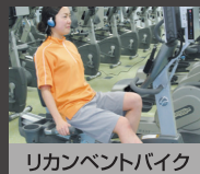
リカレントバイク