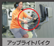
アップライトバイク