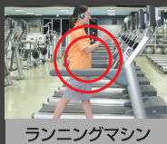
ランニングマシン