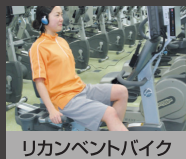
リカレントバイク