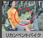
リカレントバイク