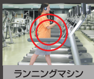
ランニングマシン