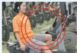
リカンベントバイク