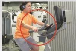
アップライトバイク