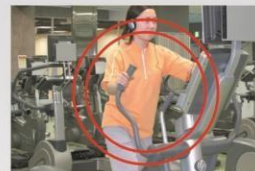
クロストレーナー