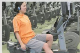
リカンベントバイク