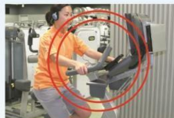
アップライトバイク