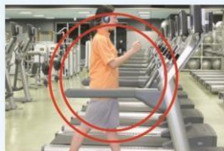
ランニングマシン

(心肺機能を高め全身的なスタミナアップ。余分な脂肪を燃焼させる。)※特にオススメ◎ オススメ○