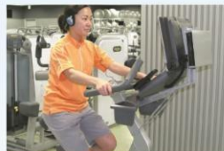
アップライトバイク