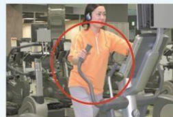
クロストレーナー