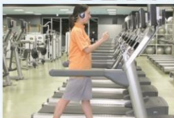
ランニングマシン

(心肺機能を高め全身的なスタミナアップ。余分な脂肪を燃焼させる。) ※特にオススメ◎ オススメ○