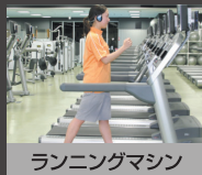
ランニングマシン