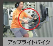
アップライトバイク