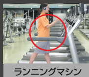
ランニングマシン