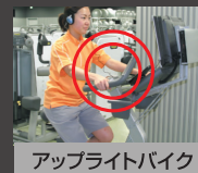
アップライトバイク