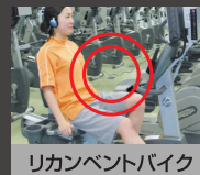
リカレントバイク