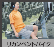
リカレントバイク