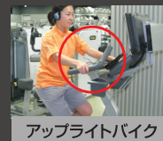
アップライトバイク