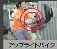
アップライトバイク