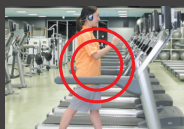
ランニングマシン