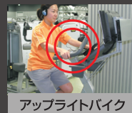
アップライトバイク