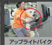
アップライトバイク