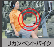
リカレントバイク