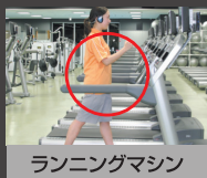
ランニングマシン