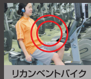
リカレントバイク