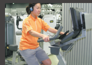
アップライトバイク