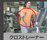
クロストレーナー