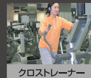
クロストレーナー