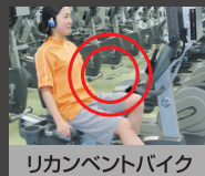
リカレントバイク