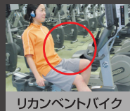
リカレントバイク