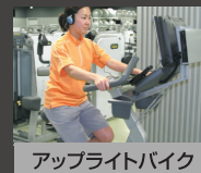
アップライトバイク