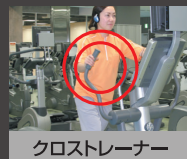
クロストレーナー