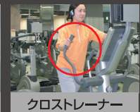
クロストレーナー