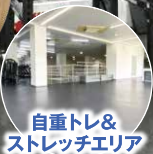
自重トレ& ストレッチエリア