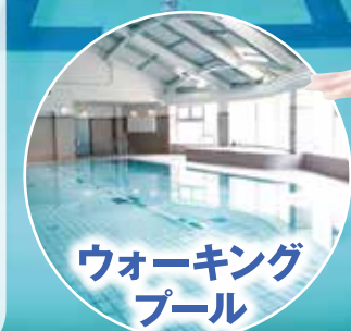
ウォーキング プール