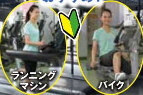
ランニング マシン